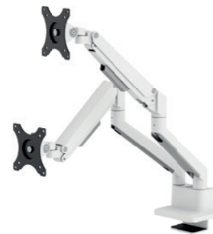
DS70-250BL2 / WH2 / SL2 Taille de l'écran: 17-32" Capacité: 9 kg (2x)