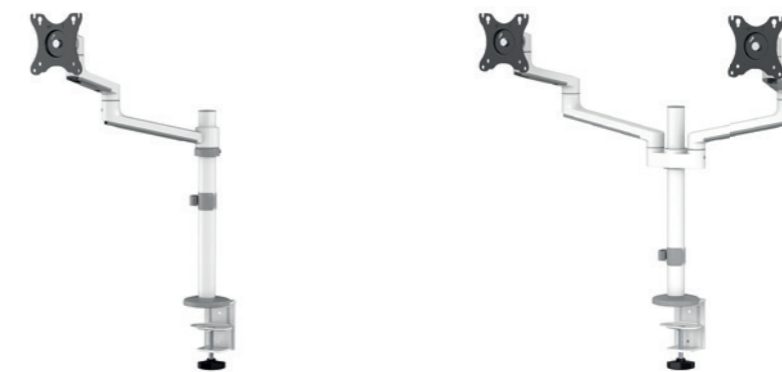
DS60-425BL1 / WH1 Taille de l'écran: 17-27" Capacité: 8 kg