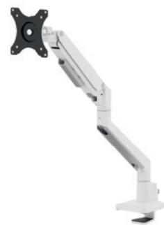
DS70-250BL1 / WH1 / SL1 Taille de l'écran: 17-35" Capacité: 9 kg