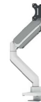
DS70PLUS-450BL1 / WH1 Taille de l'écran: 17-49" Capacité: 18 kg/incurvé 14 kg Tête renforcée