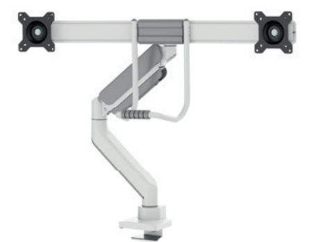
DS75-450BL2 / WH2 Taille de l'écran: 17-32" Capacité: 8 kg (2x)