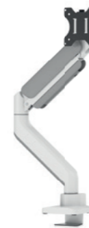
DS70-450BL1 / WH1 Taille de l'écran: 17-42" Capacité: 15 kg